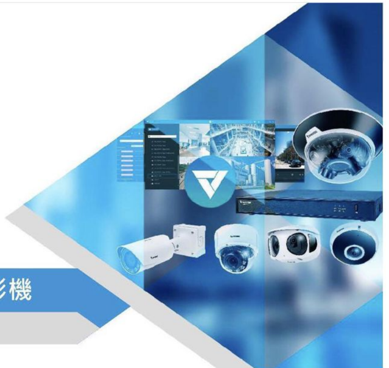
晶睿IB9387-LPR車牌辨識攝影機